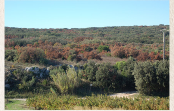
Impact de la sécheresse de l'été 2016