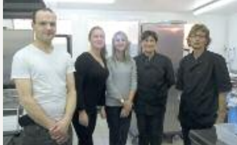
L'équipe du restaurant scolaire

Notre commune a inauguré fin septembre l'extension du restaurant scolaire ; ce bâtiment mis en service en 1984, constituait à l'époque un vrai progrès en matière d'équipement communal. Au fil des années le nombre d'enfants fréquentant la « cantine » est devenu plus important et depuis quelques temps la restauration s'effectuait sur deux services.